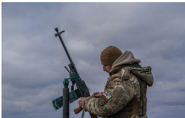
Фото: Росія вночі випустила по Україні 143 дрони та балістичні ракети

Вночі 21 квітня Росія запустила по Україні 143 ударні безпілотники та дві балістичні ракети.