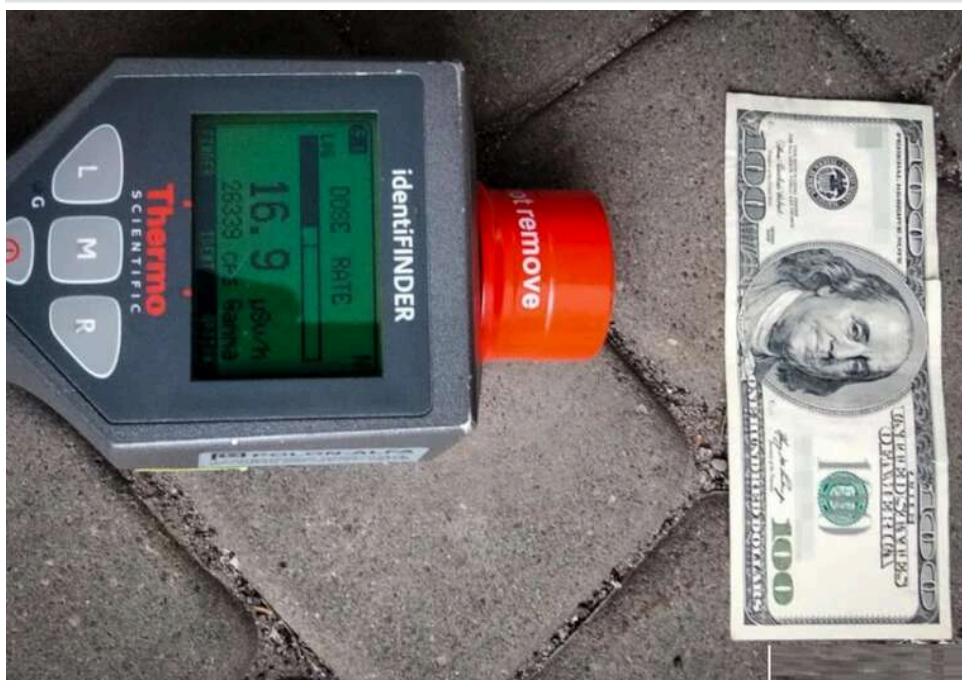
На кордоні з Польщею в українки виявили банкноту з підвищеним радіаційним фоном

На польсько-українському кордоні в 54-річної громадянки України виявили опромінену банкноту з номіналом у 100 доларів серед майже 10 тисяч доларів, які вона перевозила. За словами речника Бещадського відділення Прикордонної служби Польщі Пьотра Закелажа, її радіаційний фон був в 1905 разів більшим за фонове випромінювання в цьому місці.