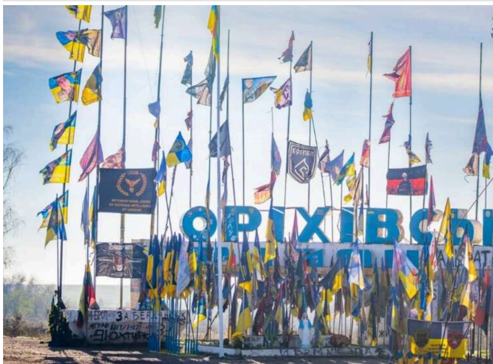
«Руйнування та порожнеча»: окупанти обстріляли Оріхівську стелу з прапорами військових підрозділів

Російські війська обстріляли Оріхівську стелу – один із символів Запорізької області. Через удар пошкоджено саму конструкцію та десятки прапорів військових підрозділів, що були на ній закріплені.