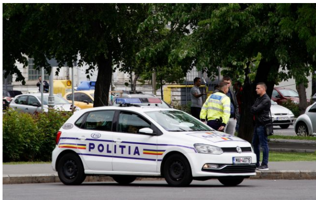
Фото: у Бухаресті пролунав гучний вибух на ТЕС (Getty Images)

У Бухаресті, столиці Румунії, пізно ввечері 20 квітня стався вибух на ТЕС, після чого виникла масштабна пожежа.