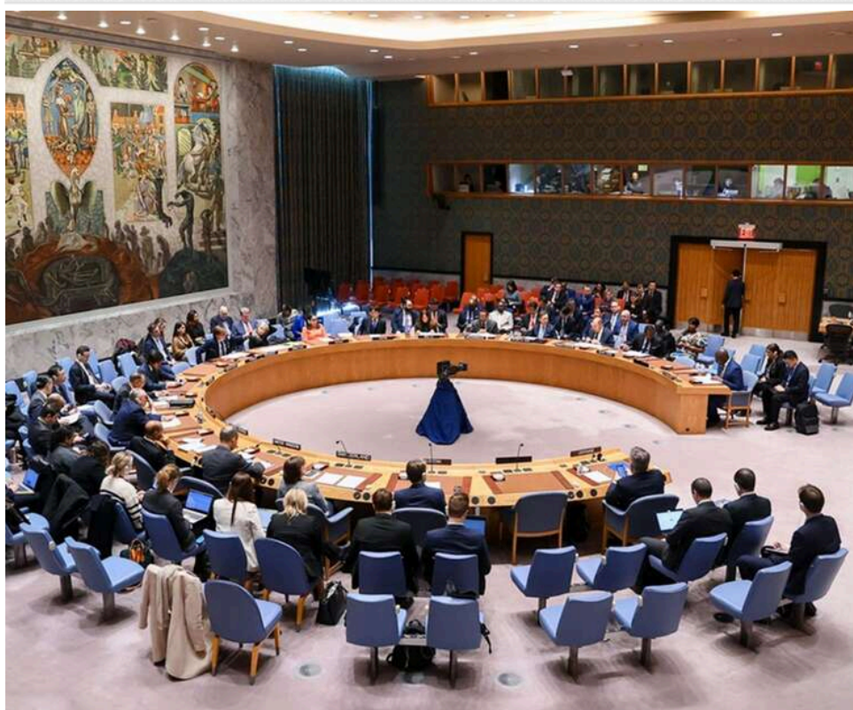
США закликали Україну і Росію до переговорів: закликали низку країн припинити підтримку РФ

Сполучені Штати закликали Росію та Україну до переговорів щодо досягнення стійкого миру та підтвердили намір продовжувати зусилля з припинення війни.