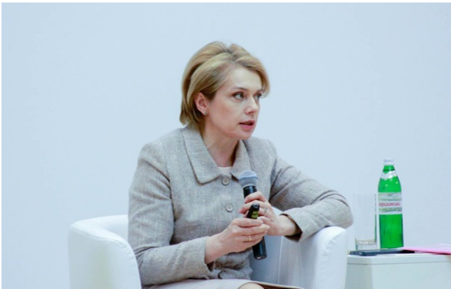
Гриневич прокоментувала рішення Угорщини