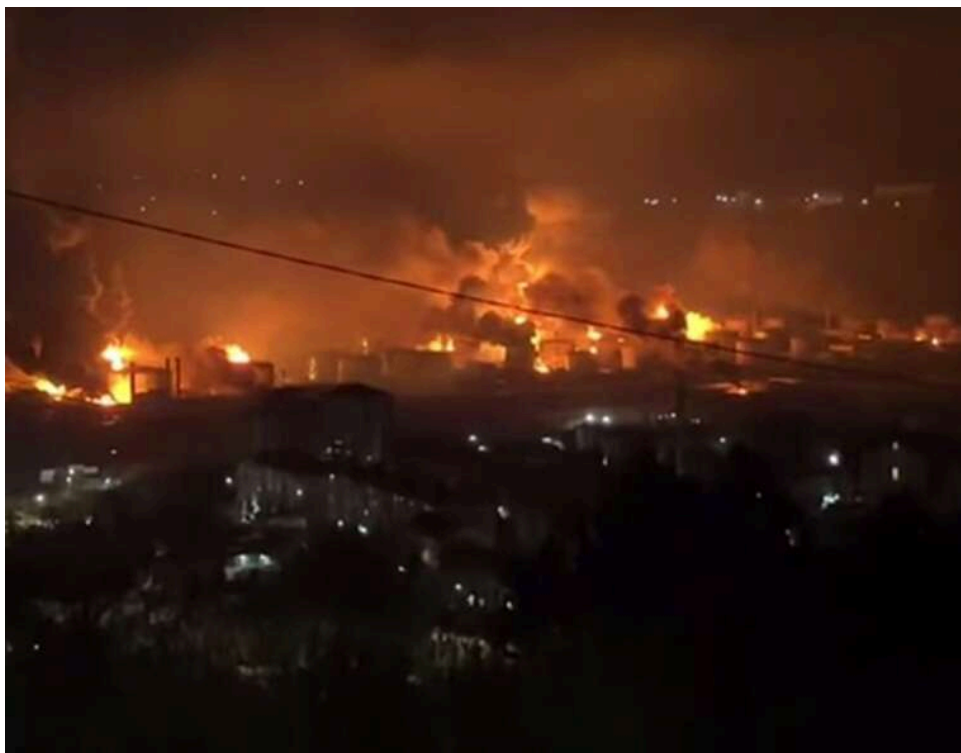
Трафік упав удвічі: після атаки дронів морський термінал у Туапсе майже припинив прийом суден

Після ударів українських дронів по морському нафтоналивному терміналу в Туапсе кількість суден, які заходять до порту, зменшилася удвічі за одну добу.