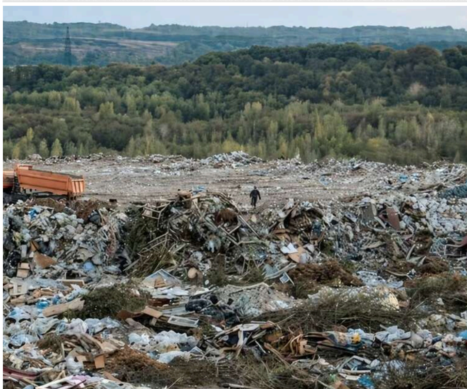
Збитки на 1,3 мільярда: справу голови «Київспецтранс» щодо масштабного засмічення столиці передали до суду

Прокурори Київської міської прокуратури направили до суду обвинувальний акт стосовно голови правління ПРАТ «Київспецтранс» у справі про масове засмічення територій у столиці, повідомляє Офіс генпрокурора.