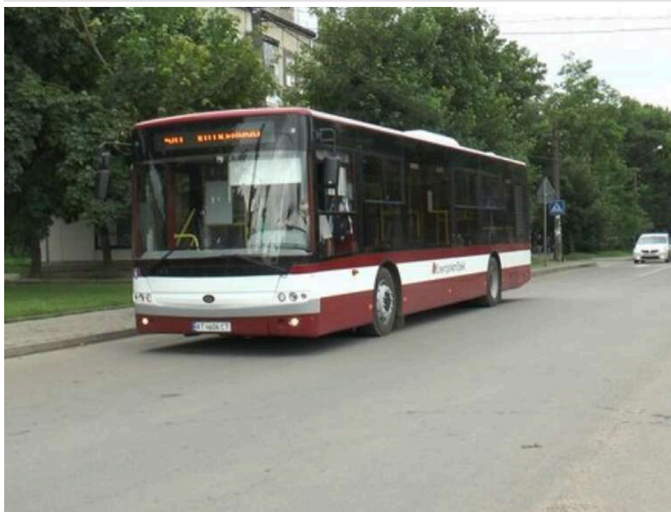
Суд в Івано-Франківську оштрафував чоловіка на 17 тисяч гривень за хуліганство в автобусі

Івано-Франківський міський суд виніс вирок чоловіку, який вчинив хуліганські дії в громадському транспорті. Подія сталася 22 березня близько 15:30.