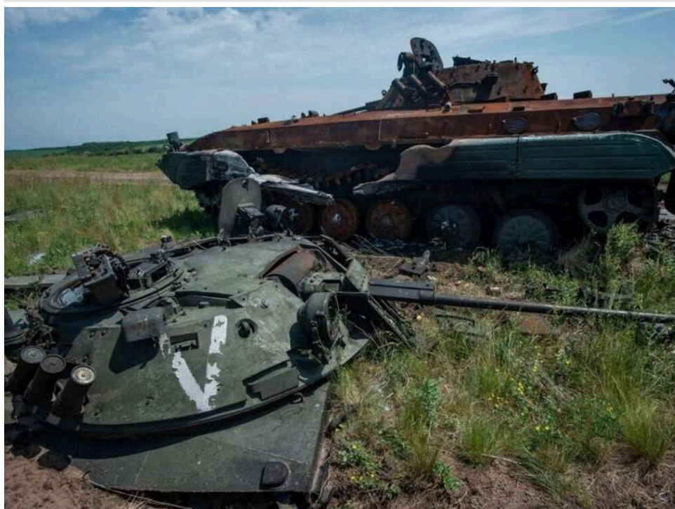
Втрати ворога за добу: ЗСУ знешкодили 1040 окупантів і 7 бронемашин

За добу, 20 квітня, українські воїни знищили та поранили ще 1040 російських загартників. Крім того, на полі бою було уражено десятки одиниць різної ворожої техніки.