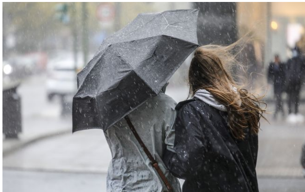
Фото: синоптики дали прогноз погоди на 21 квітня

Сьогодні, 21 квітня, в Україні прогнозується прохолодна погода з дощами, поривчастим вітром і нічними заморозками. У Карпатах очікуються морози та мокрий сніг.