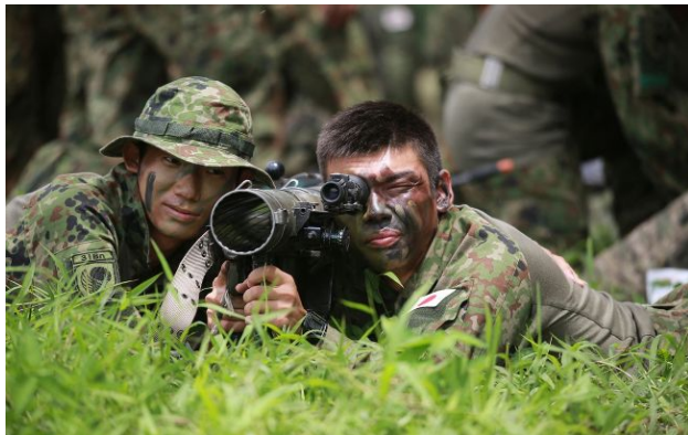
Фото: японські сили самооборони (Getty Images)

Японія офіційно дозволила продаж летальної зброї власного виробництва іншим країнам. Цей крок фактично ставить крапку в епосі повоєнного пацифізму, який тривав понад вісім десятиліть.