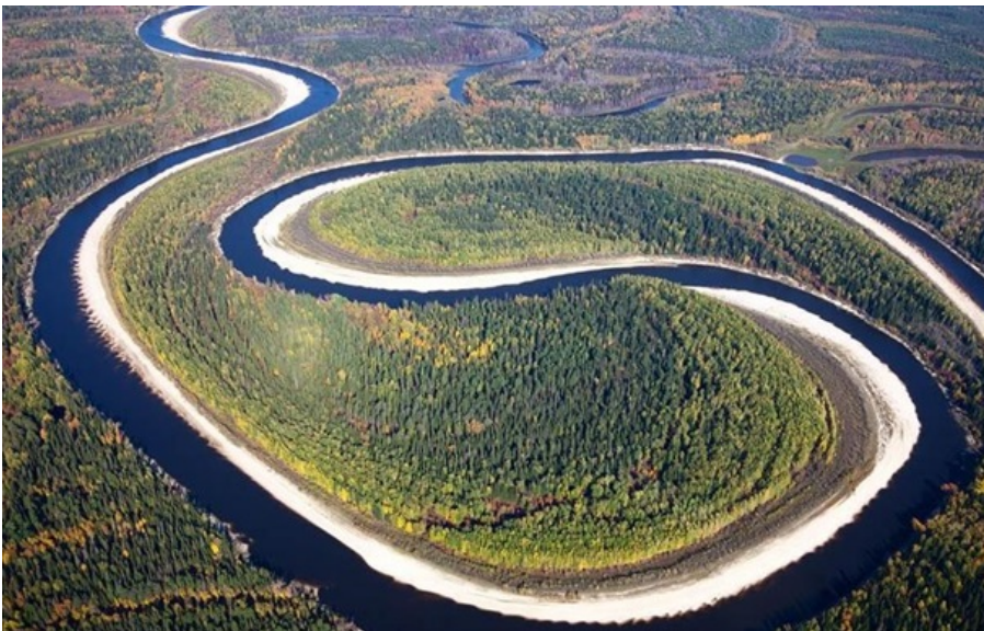
(ілюстративне фото)

Замість відкритого каналу для перекидання води використовуватимуться пластикові труби