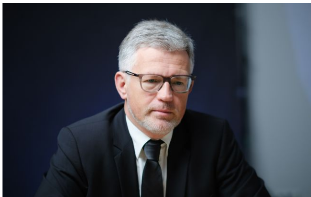
Фото: постійний представник України в ООН Андрій Мельник

Постійний представник України при ООН Андрій Мельник заявив, що Україна відкидає російські ультиматуми та не залишить жодного квадратного міліметра своєї території.