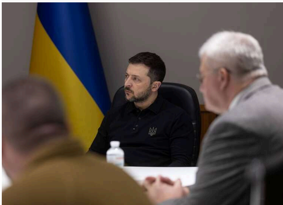
Bloomberg: Зеленський очікує нового наступу Росії влітку