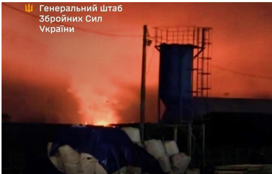
В Усть-Лузі знову спалахнула сильна пожежа

Також військові уточнили результати уражень в порту Приморськ і на НПЗ Лукойлу в Нижньому Новгороді.