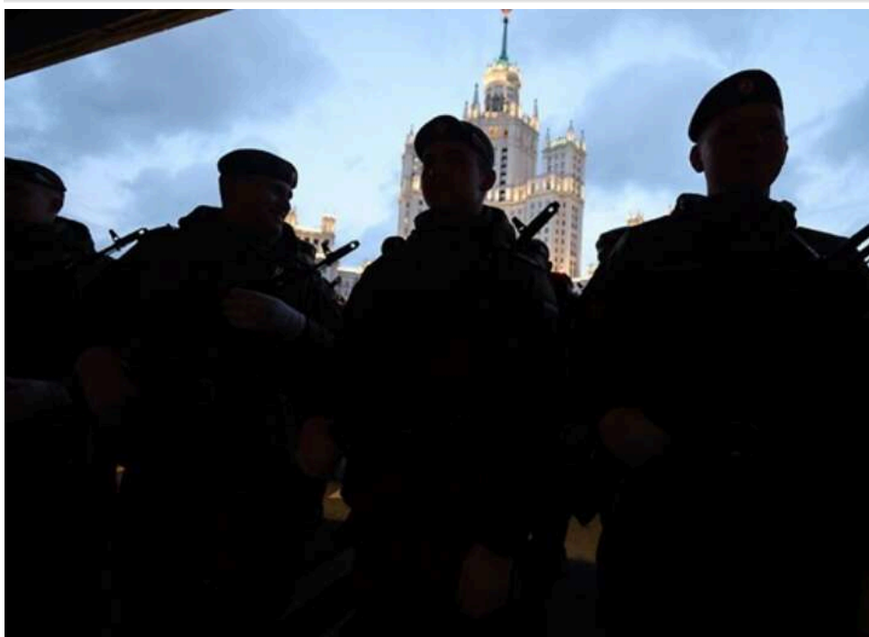
МЗС РФ офіційно попередило про плани удару по Києву в разі провокацій на параді в Москві

Росія попереджає про можливий удар «по центрах прийняття рішень» у Києві, якщо Україна завдасть ударів по параді 9 травня в Москві.