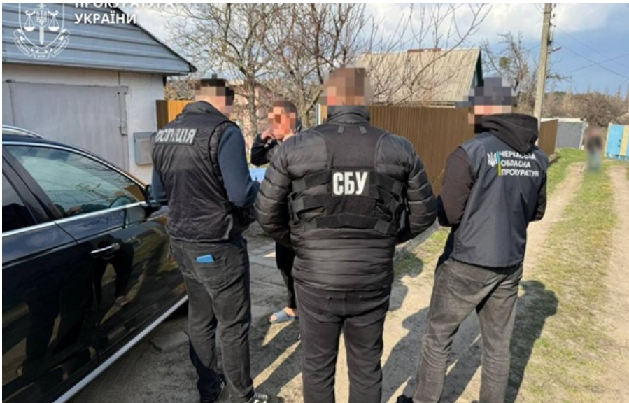
Фігурант отримав підозру

Колишній директор підрядного підприємства організував привласнення коштів, виділених на відбудову.