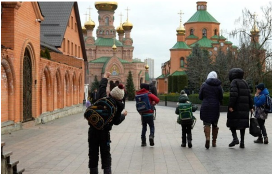
Киевский монастырь Голосеевская пустынь проверили на связи с РПЦ