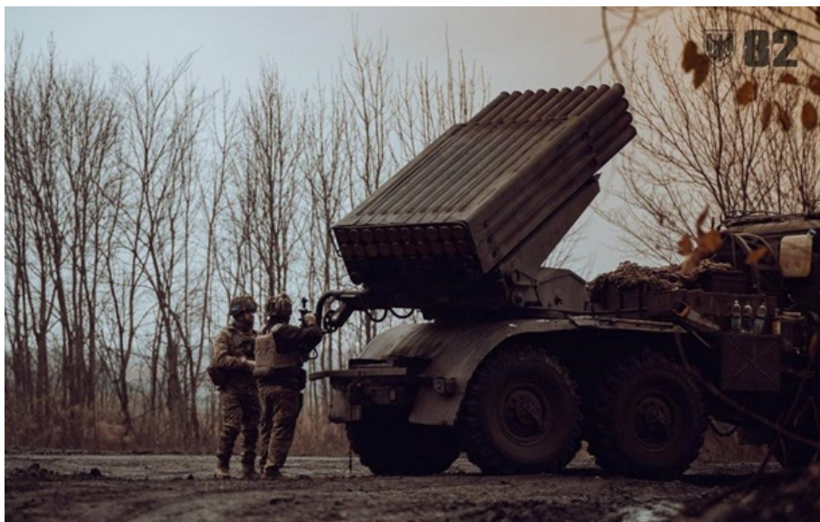
Фото: 82 ОДШБр ЗСУ стримують російські атаки на сході і півдні України

Найбільш активно російські загарбники намагаються атакувати в районі Костянтинівки. Там ЗСУ вже відбили 20 штурмів.