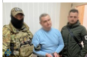
Агент РФ шпигував на стратегічному заводі - СБУ 7 квітня 2026, 10:47