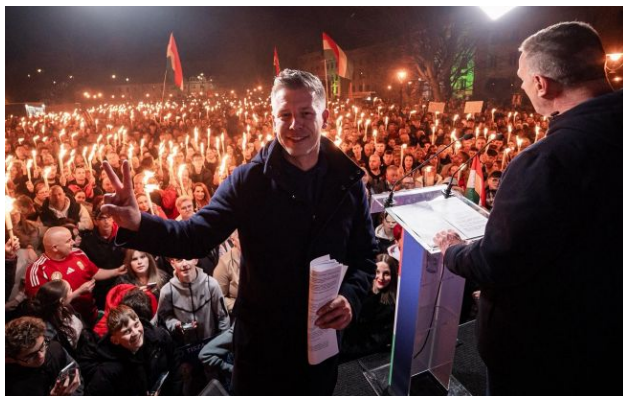
Фото: майбутній прем'єр Угорщини Петер Мадяр

Виступаючи перед журналістами в Будапешті, майбутній прем'єр Угорщини Петер Мадяр заявив, що його колега - ізраїльський прем'єр Бен'ямін Нетаньягу - може бути заарештований у цій країні. Все через рішення Міжнародного кримінального суду.