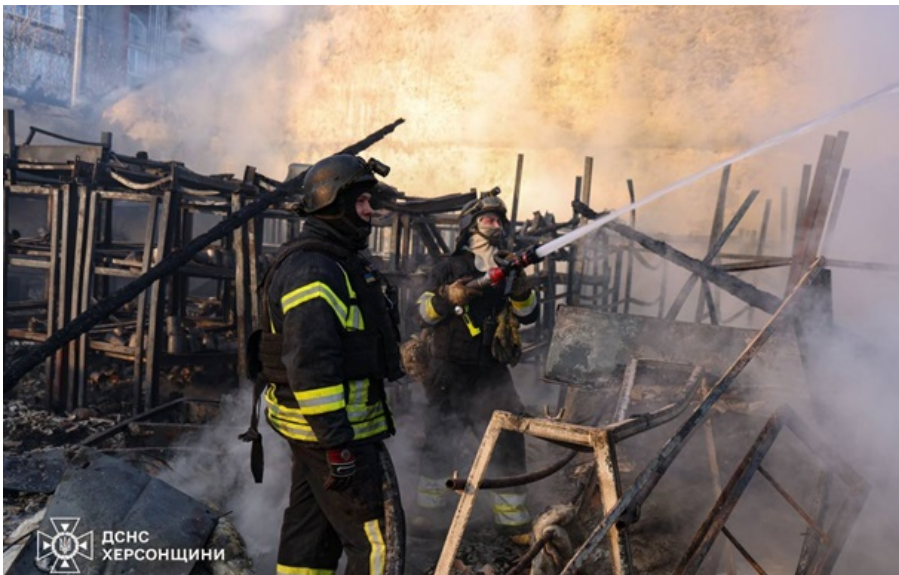
Рятувальники ліквідують наслідки російських ударів

Стало відомо про ще одного херсонця, який отримав смертельні поранення внаслідок обстрілу Корабельного району.