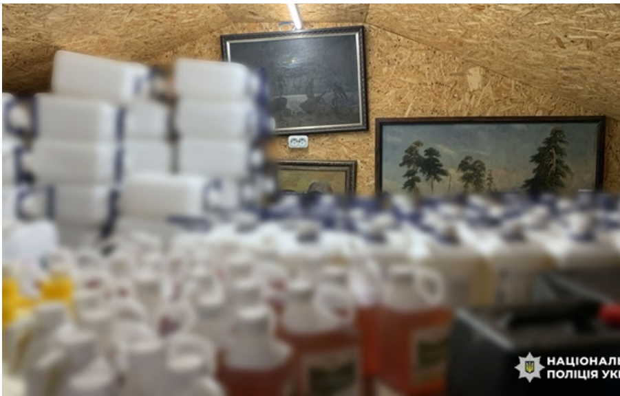
В Україні виявили збут контрафактних агрохімікатів

Правоохоронці провели 16 обшуків, під час яких вилучили понад 4 тисячі одиниць пакувальної тари, агрохімікатів та поліграфічних матеріалів.