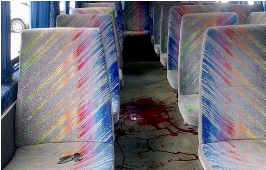
Поранені жінка та четверо чоловіків

У Червоногригорівській громаді пошкоджений мікроавтобус, який обслуговує міжміський маршрут.