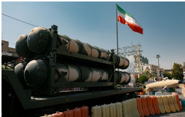
Фото: виставка ракетної зброї Ірану (Getty Images)

Іранська армія зберегла значну частину своєї вогневої потужності навіть після тижнів масованих бомбардувань з боку США та Ізраїлю. В арсеналі Тегерана досі залишаються тисячі ракет та ударних безпілотників.