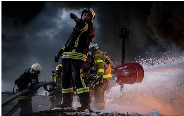
Фото: рятувальники працюють на місці влучання (facebook.com/DSNSPOLTAVA)

У ніч на 21 квітня російські окупанти завдали масованого удару безпілотниками по обласному центру Суми.