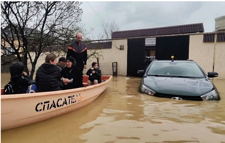
Наслідки прориву греблі в Дагестані

У російській республіці сильні дощі змивають будинки та мости. Окрім цього стався прорив дамби, проходить евакуація тисяч людей.