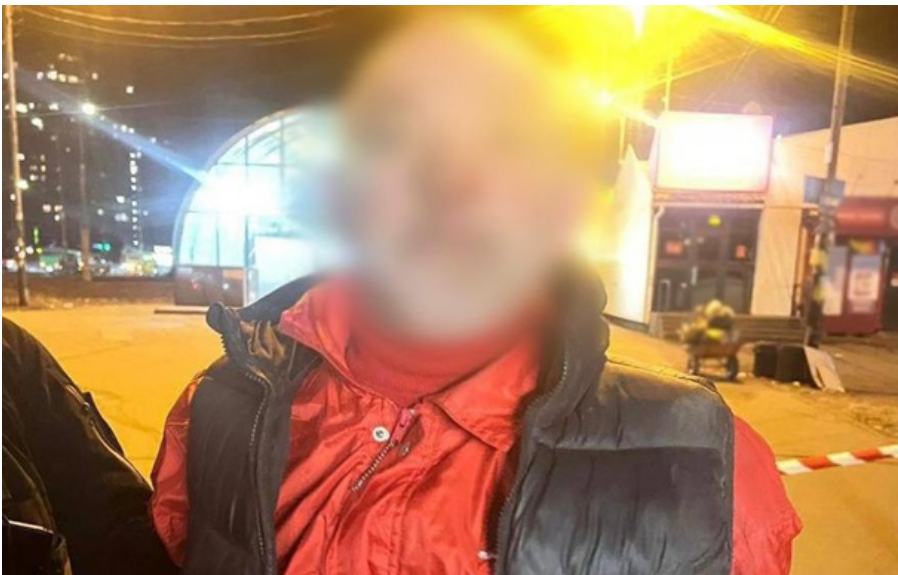
В Киеве иностранец угрожал прохожим гранатой

Мужчина, находясь в состоянии алкогольного опьянения, достал гранату и начал угрожать ею окружающим.