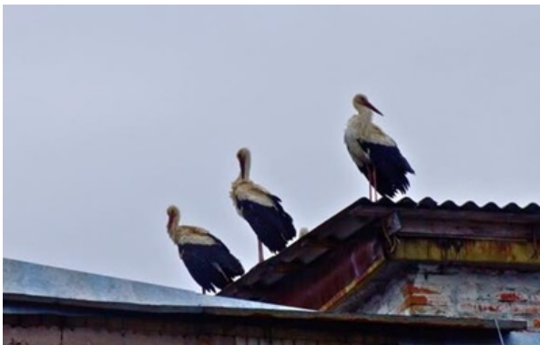
Білі лелеки повернулися до Чорнобиля після 20 років

Шість птахів сіли відпочити на дах адміністративної будівлі біля меморіалу, що свідчить про можливі зміни в локальній популяції.