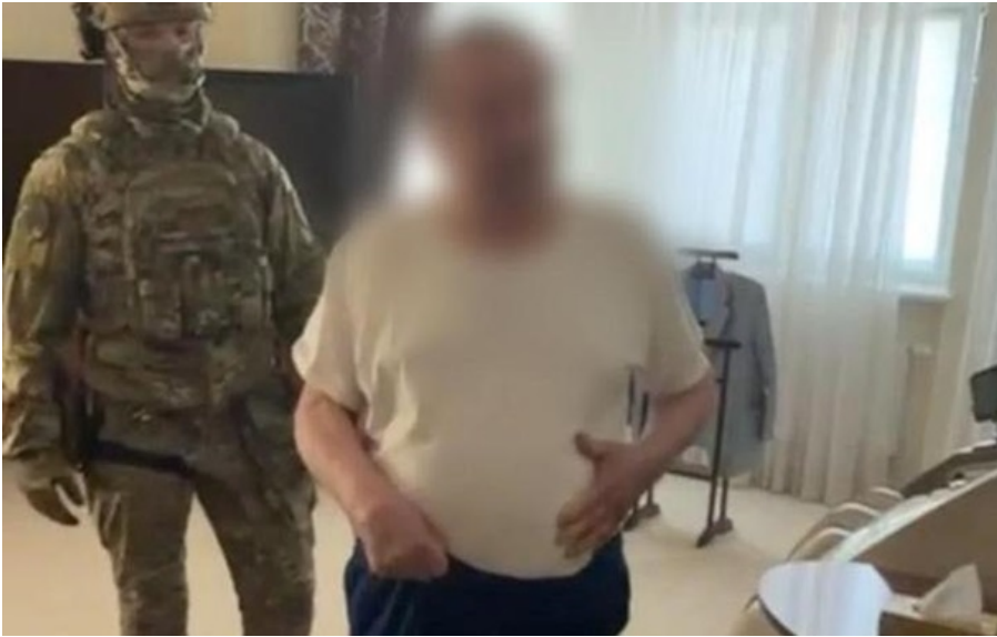
Раскрыта схема растраты в особо крупных размерах в Киевском университете культуры