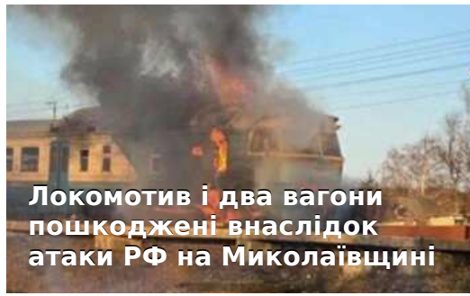
Локомотив і два вагони пошкоджені внаслідок атаки РФ на Миколаївщині