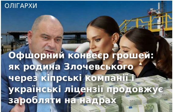
Офшорний конвеєр грошей: як родина Злочевського через кіпрські компанії і українські ліцензії продовжує заробляти на надрах