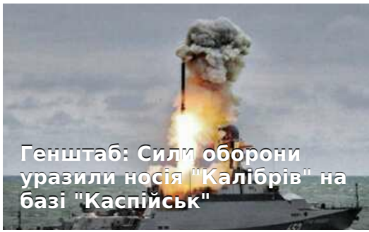
Генштаб: Сили оборони уразили носія "Калібрів" на базі "Каспійськ"