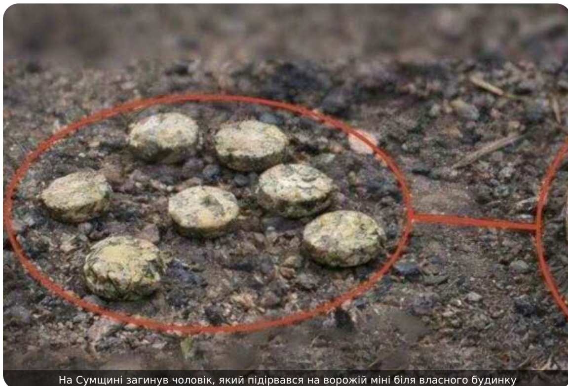
На Сумщині загинув чоловік, який підірвався на ворожій міні біля власного будинку

На Сумщині 69-річний чоловік загинув, підірвавшись на вибуховому пристрої біля свого будинку.