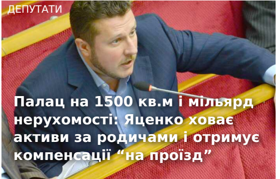
Палац на 1500 кв.м і мільярд нерухомості: Яценко ховає активи за родичами і отримує компенсації "на проїзд"