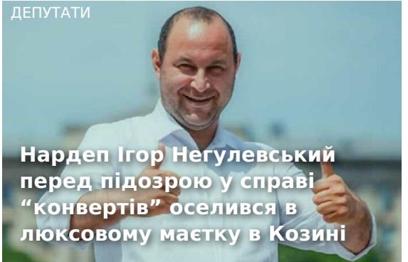
Нардеп Ігор Негулевський перед підозрою у справі "конвертів" оселився в люксовому маєтку в Козині