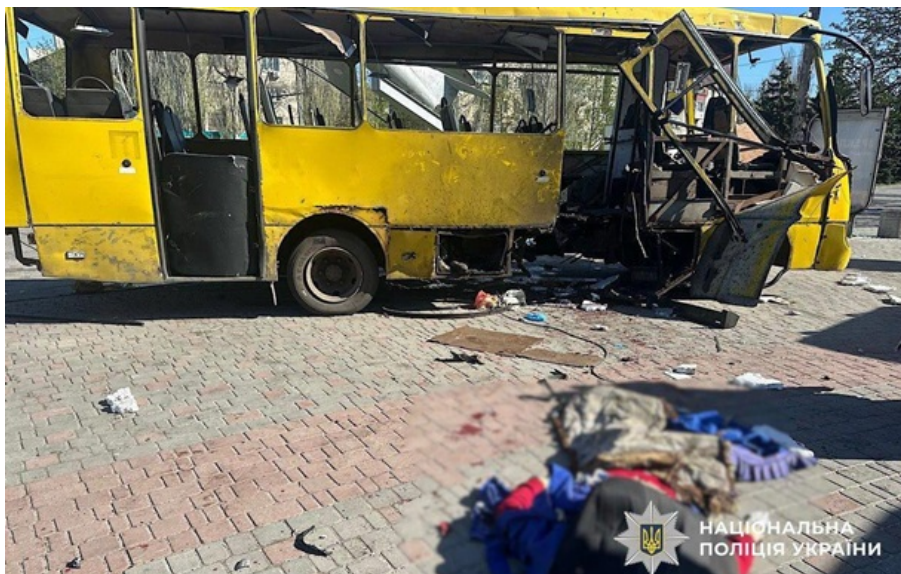
Пошкоджена маршрутка в Нікополі

Кількість жертв удару російського дрона по звичайній маршрутці зростає до чотирьох осіб, а число поранених - до 16, зазначив президент.