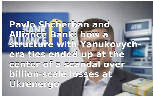
Pavlo Shcherban and Alliance Bank: how a structure with Yanukovich-era ties ended up at the center of a scandal over billion-scale losses at Ukrenergo