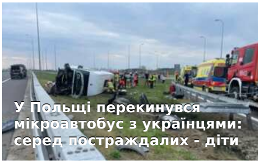
У Польщі перекинувся мікроавтобус з українцями: серед постраждалих - діти