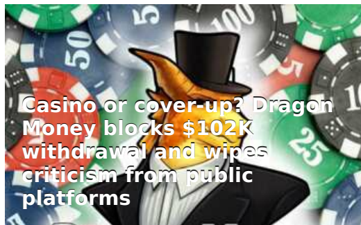
Casino or cover-up? Dragon Money blocks $102K withdrawal and wipes criticism from public platforms