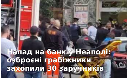
Напад на банк у Неаполі: озброєні грабіжники захопили 30 заручників