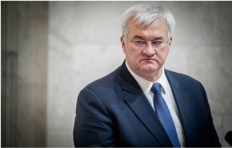
Міністр закордонних справ України Андрій Сибіга

Сибіга заявив, що росіяни звернулися до пропаганди, щоб спробувати підірвати внесок України у Затоці.