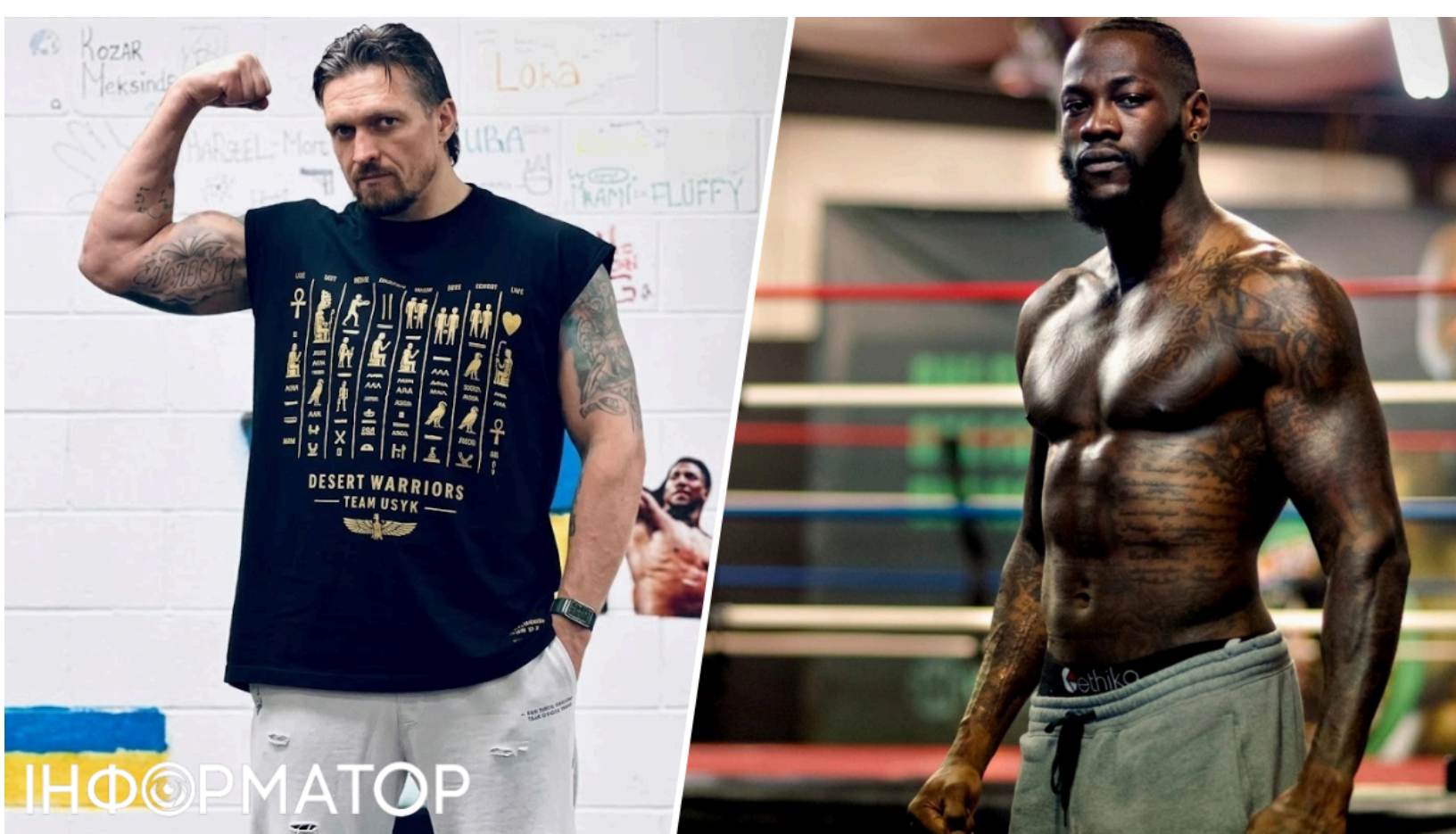
Усик завершить кар'єру босм проти Вайлдера

Олександр Усик обрав суперника для свого прощального бою в професійній кар'єрі - ним стане американський нокаутер Деонтей Вайлдер. Переговори щодо організації мегафайту вже тривають на найвищому рівні, а найбільш логічним місцем для поєдинку команда українця називає США. 39-річний боксер залишається непереможеним у 25 боях і налаштований поставити красиву крапку в блискучій кар'єрі - з правильним суперником, на правильному майданчику.