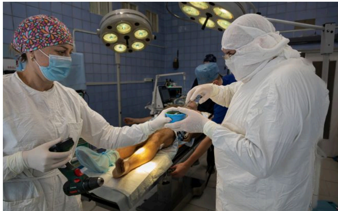
Фото: робота медичних працівників (Getty Images)