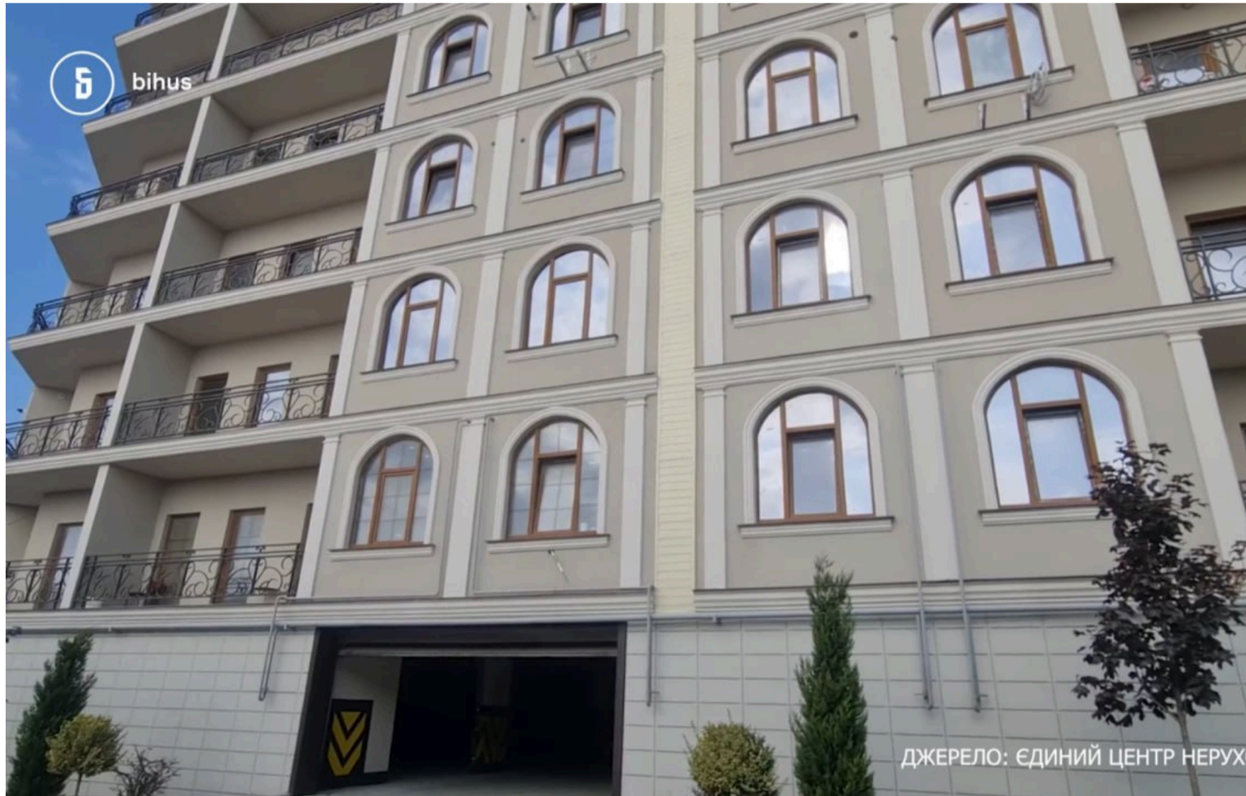
Клубний будинок «Авіньйон».