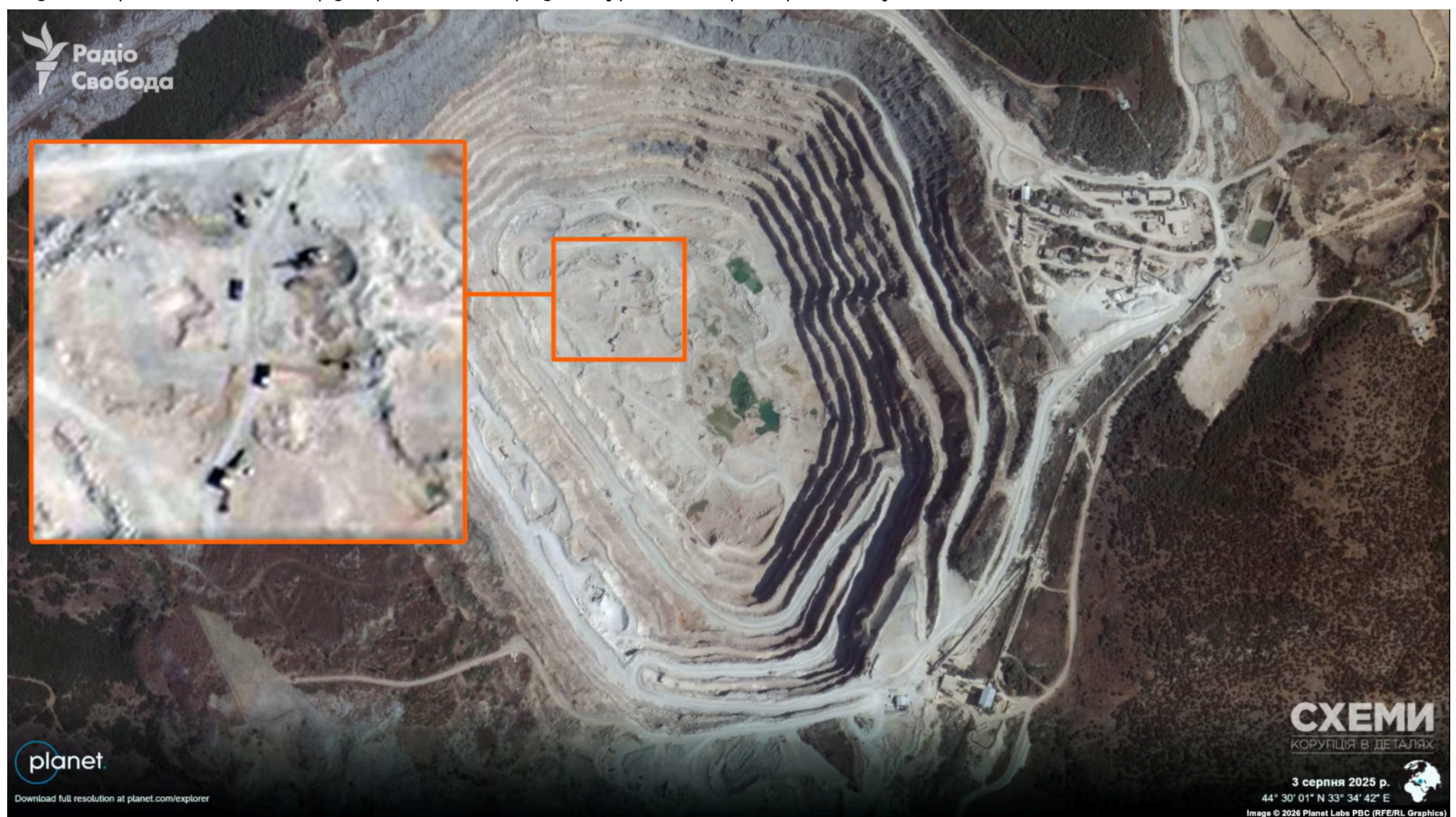
Робота техніки в одному з кар'єрів «Балаклавського рудоуправління»

«Балаклавське рудоуправління» і нині продовжує активну діяльність, хоча і зі збитками – про це свідчить звіт про рух коштів компанії та аналіз супутникових знімків Planet Labs, на яких видно роботу техніки в одному з кар'єрів підприємства. Крім цього, за даними з російських реєстрів, кримське підприємство з 2022-го до 2025 року сплатило в бюджет РФ понад 2 мільярда рублів податків (це близько 1 мільярда гривень за середнім курсом тих років), — пишуть «Схеми».