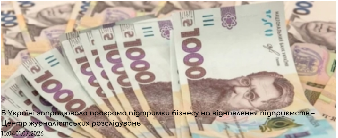
В Україні запрацювала програма підтримки бізнесу на відновлення підприємств – Центр журналістських розслідувань 15:0401.07.2026