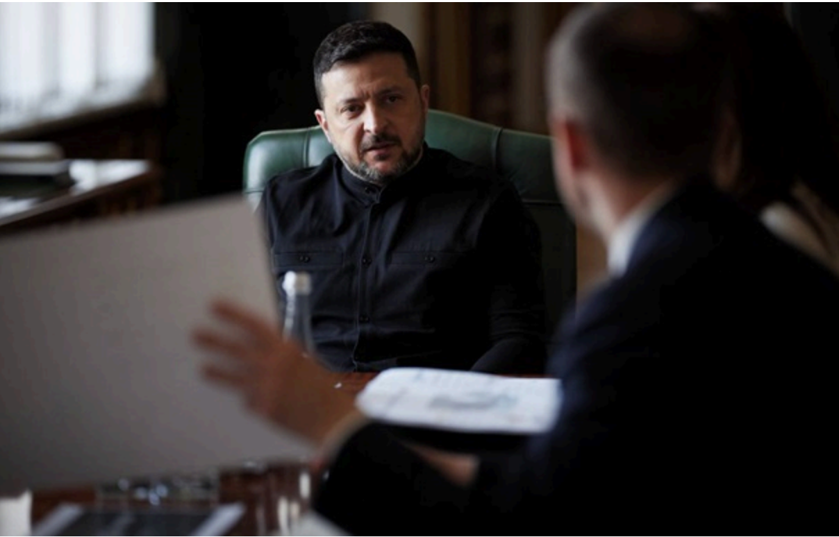
Президент України Володимир Зеленський

Глава держави попередив про можливі кадрові рішення стосовно керівників тих регіонів та громад, які зривають графіки підготовчих робіт.