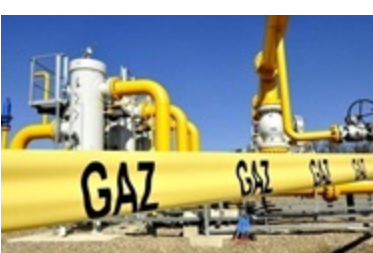
Європа може зустріти зиму з надлишками за 15 років запасами газу 29 червня 2026, 11:23