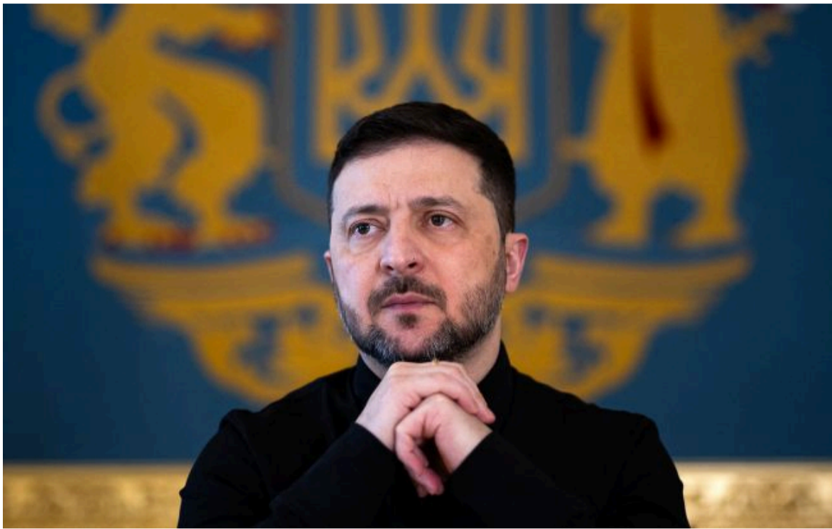
Фото: Володимир Зеленський, президент України