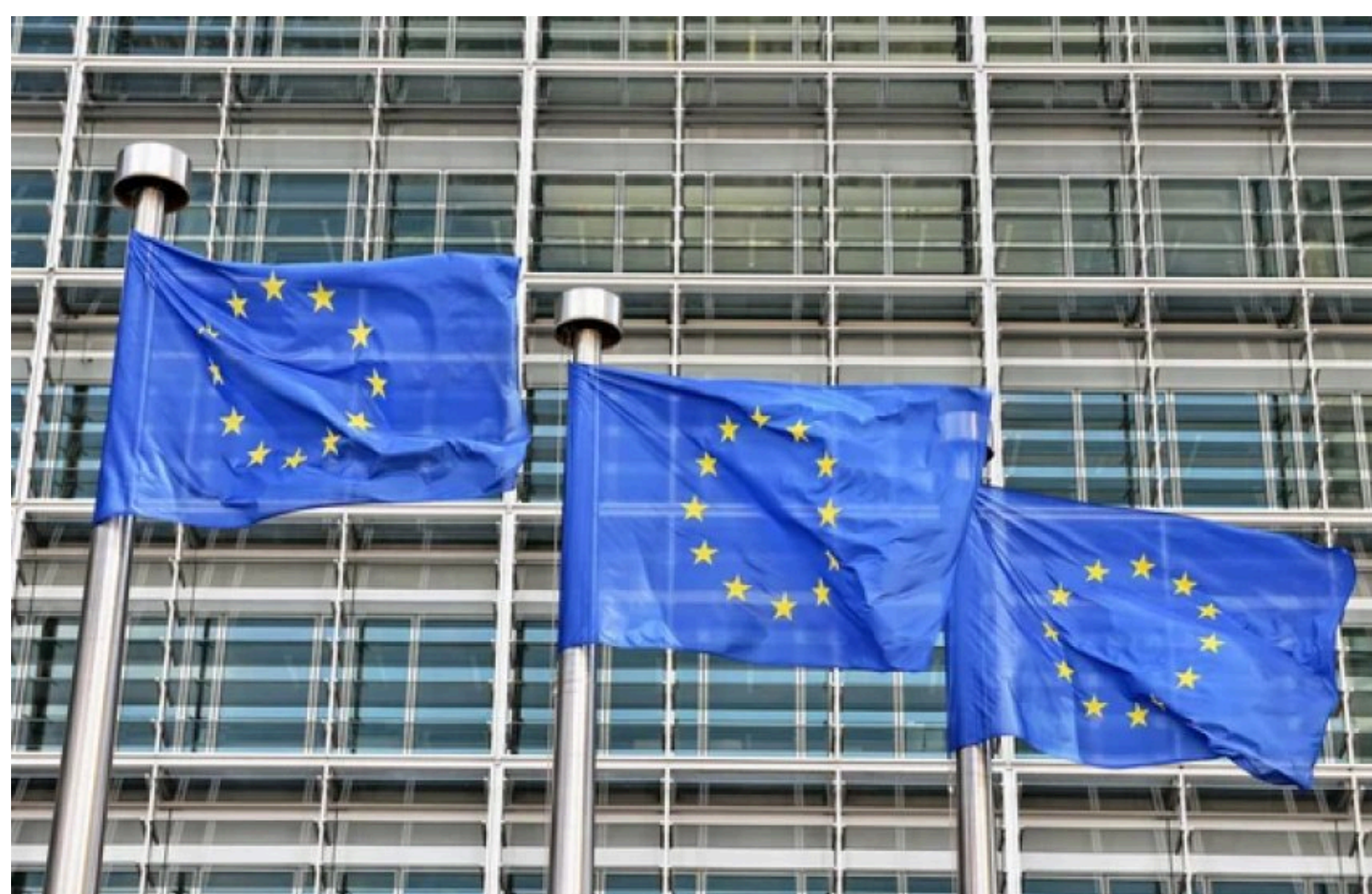
Євросоюз дав Україні 3,8 млрд євро

До спеціального фонду державного бюджету України надійшло ще 3,8 млрд євро позики від Європейського Союзу, які будуть використані на потреби оборони.