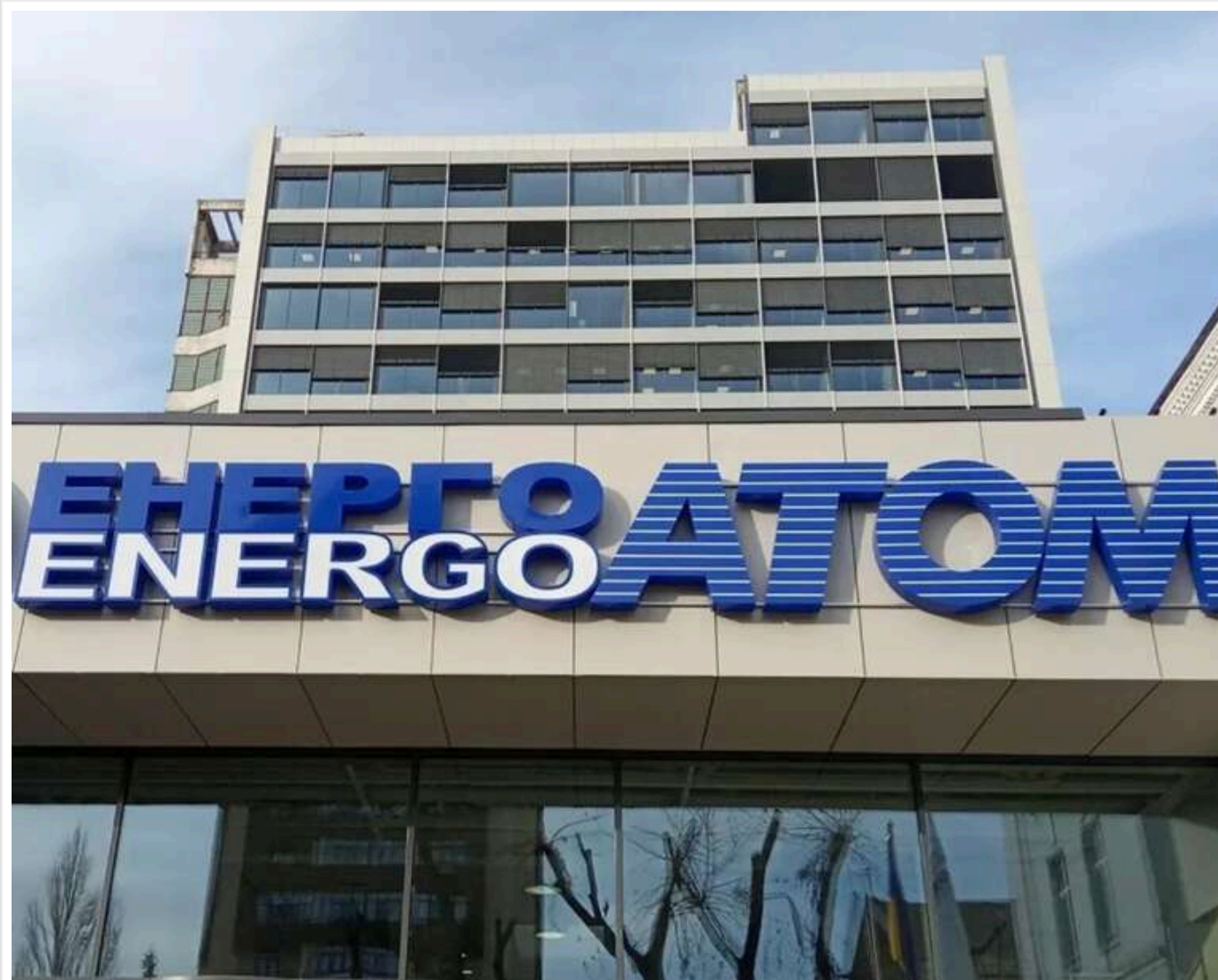
Уряд затвердив склад наглядової ради «Енергоатому» за участі міжнародних експертів

Читати на руськом Read in English Додати як бажане джерело в Google