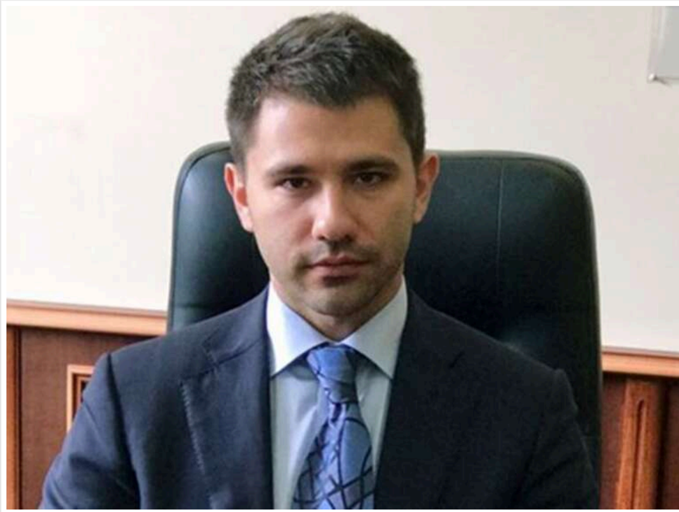
Мільярди - на папері, розкіш - у Козині: як Павло Барбул та «Спецтехноекспорт» роками заробляли на оборонних контрактах

Читати на русском Read in English Додати як бажане джерело в Google