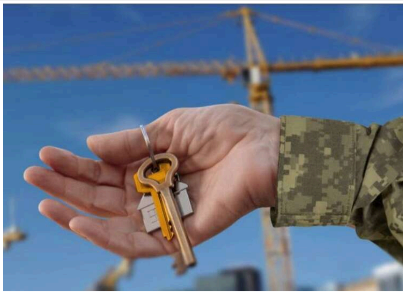
Житло для захисників: мобілізовані військовослужбовці тепер можуть отримати іпотеку під 3%

Читати на руском Додати як бажане джерело в Google