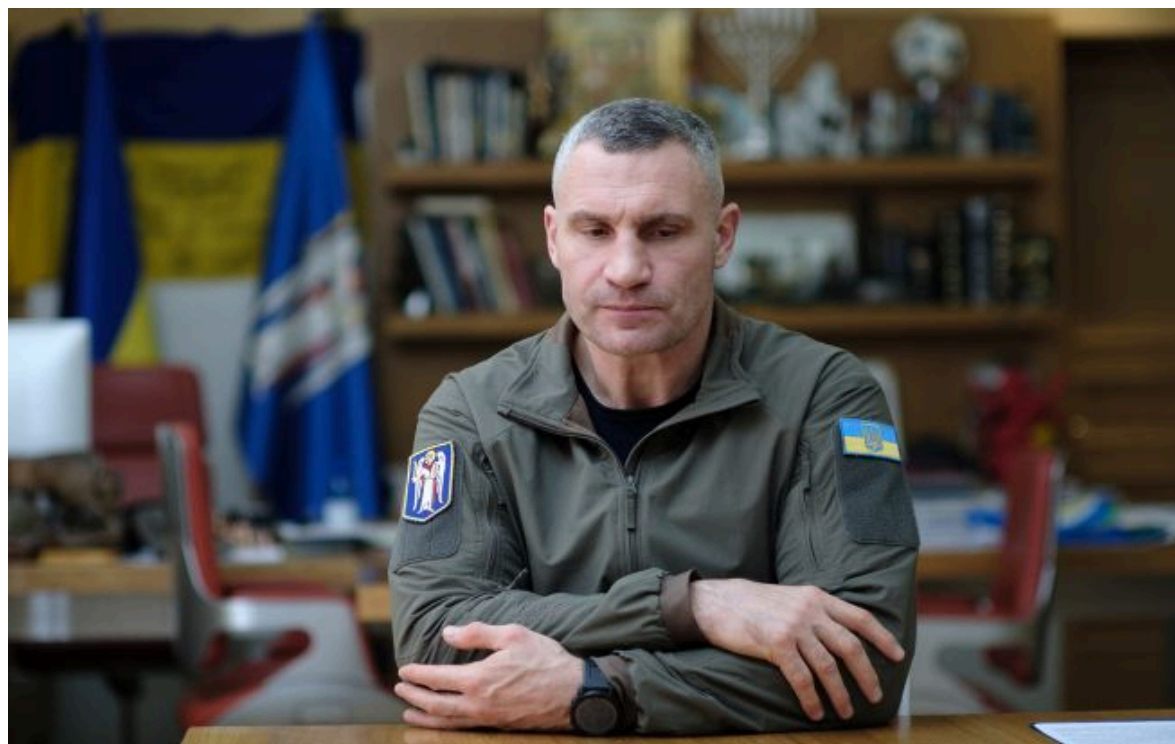
Фото: теплостанання столиці – головний виклик уряду та КМДА