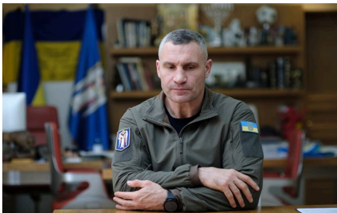
Фото: теплостачання столиці – головний виклик уряду та КМДА

Не витрачай час на шум! Читай тільки суть з РБК-Україна у Google