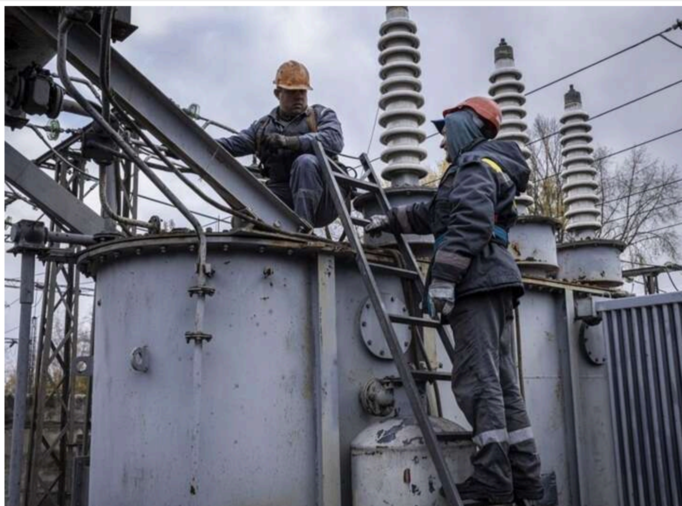
Уряд дозволив бронювати 100% працівників на підприємствах з виробництва трансформаторів

Читати на руском Read in English Додати як бажане джерело в Google