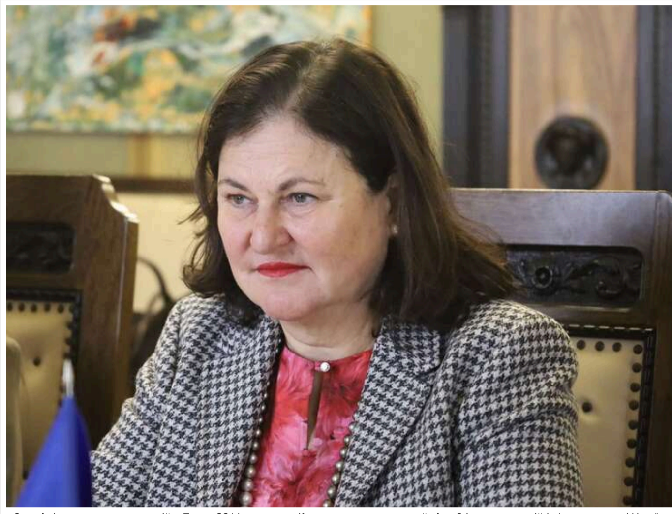
«Сьогодні я знову спала у ванній»: Посол ЄС Матернова відреагувала на масований удар РФ по критичній інфраструктурі України

Посол Європейського Союзу в Україні Катеріна Матернова провела ніч у ванній кімнаті через російські удари по Києву, що були спрямовані на цивільну інфраструктуру - джерела тепла та електроенергії.