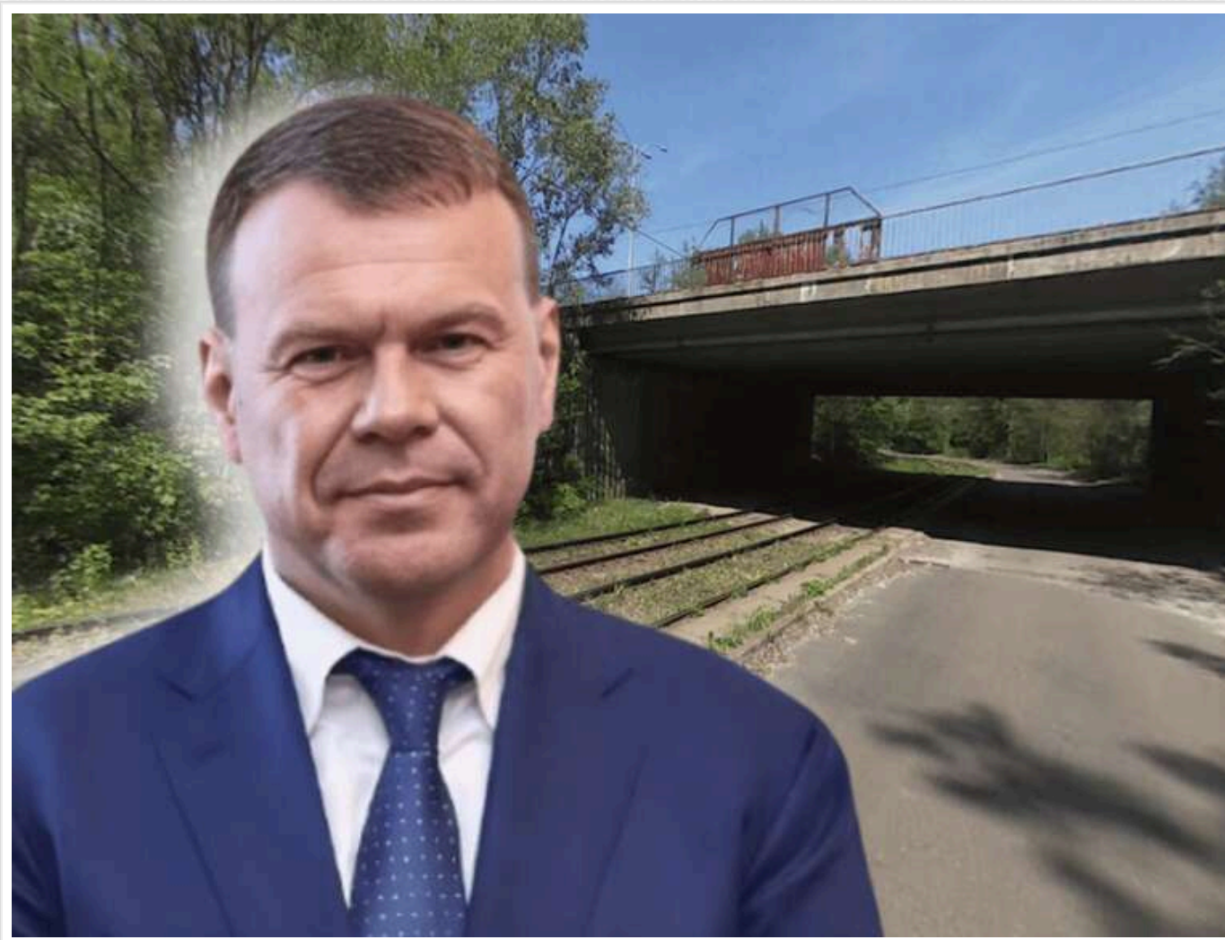
Тандем під підозрою: КП “Київавтошляхміст” віддало великий підряд компанії, що фігурує в схемах СБУ та прокуратури

КП “Київавтошляхміст” за 95,3 млн гривень замовило оновлення шляхопроводу над трамвайними коліями на Окружній дорозі в Подільському районі столиці. Підрядником обрали ТОВ “Д-Груп Інжиніринг” із край суперечливим досьє: раніше ця компанія отримувала лише два дрібні бюджетні підряди загальною вартістю трохи понад 20 тисяч гривень, була заснована особою без жодного іншого бізнесу, деякий час належала офшорній фірмі та навіть була підловлена Антимонопольним комітетом у змові на тендері. Також “Київавтошляхміст” не спинило те, що “Д-Груп Інжиніринг” фігурує щонайменше у двох кримінальних провадженнях як учасник схем із відмивання бюджетних коштів.